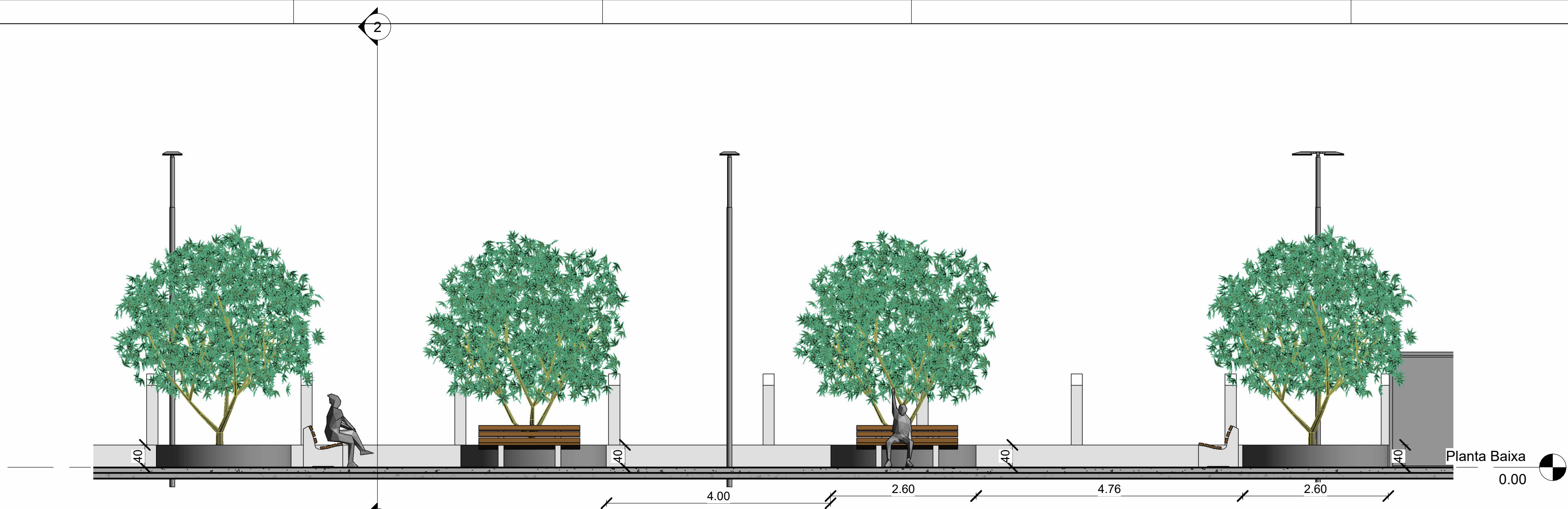
1 CORTE AA 1 : 60