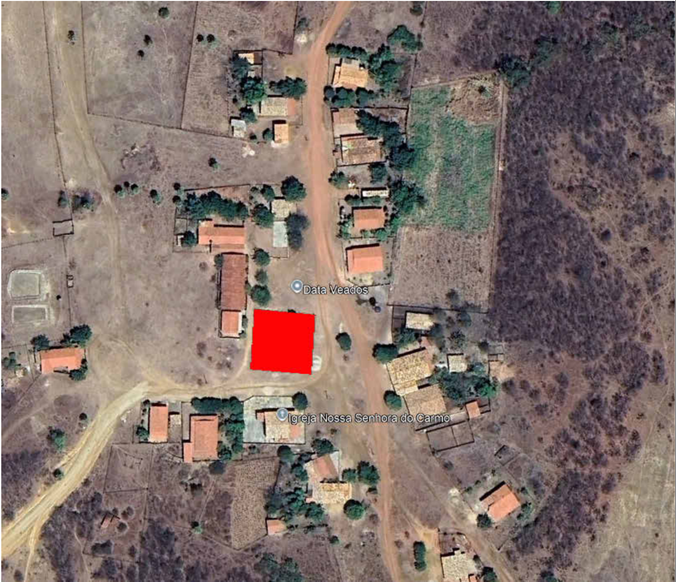
1 Situação 1 : 300